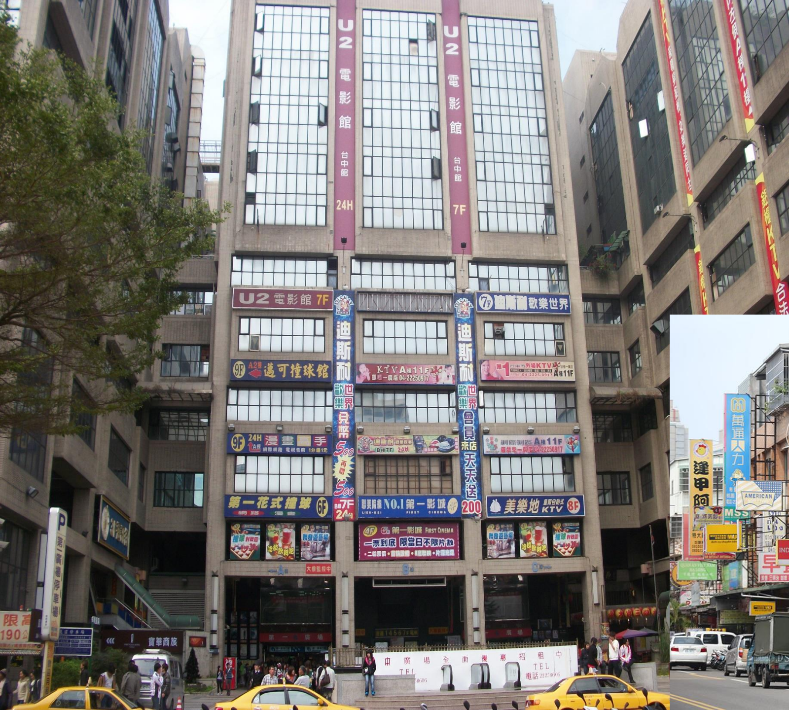
左圖: 台中東協廣場 下圖: 桃園中壢後火車站商圈